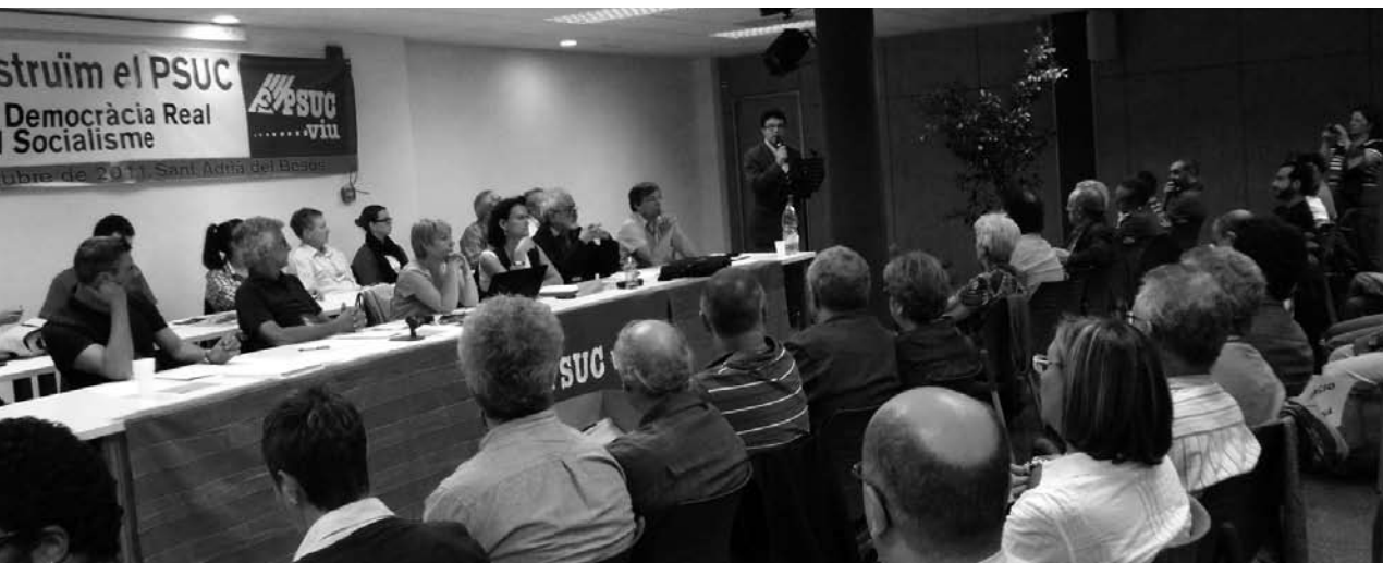
Imagen de una sesión celebrada durante el XV Congreso del PSUC-viu

(...) la inmensa mayoría de afiliados al PCE (e incluso la mayoría de afiliados a IU que no pertenecen al PCE) son partidarios de profundizar en las ideas de una alternativa cada vez más clara al capitalismo, de sacar al PCE e IU a la calle, (...)